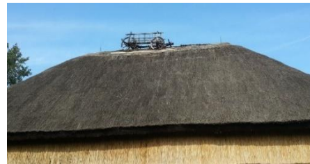
Szekér a hatalmas nádtetőn

Szentendre Skanzen: 2000 Szentendre, Sztaravodai út 7.